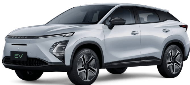
Khaki biela 400 €