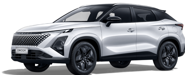
Khaki biela a Čierny top 700 €