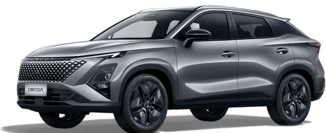
Fantómovo sivá 400 €