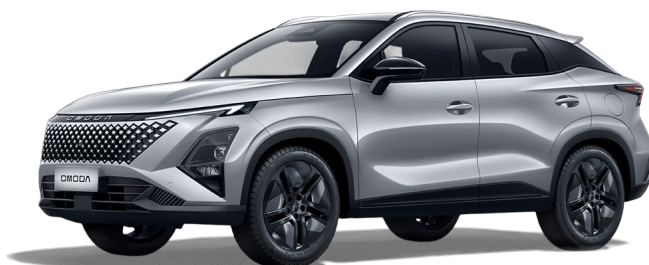
Kovovo strieborná 400 €