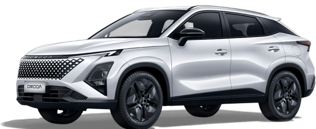
Khaki biela 400 €