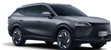
Matte Gray 800 €