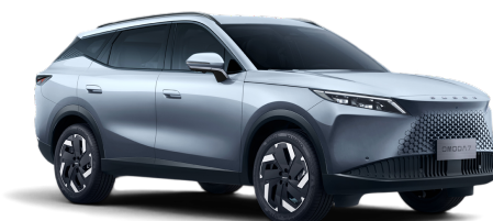
Moonlight Silver 500 €