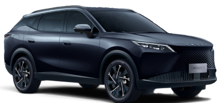
Carbon Black 500 €