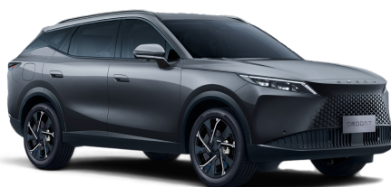
Matte Gray 800 €