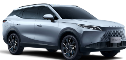
Moonlight Silver 500 €