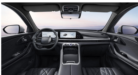
Čierny interiér 1500 €