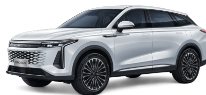
Khaki White 600 €