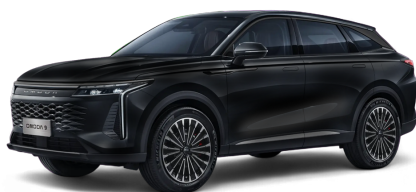
Matte Black 1500 €