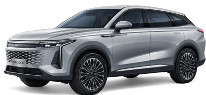
Tech Gray 0 €