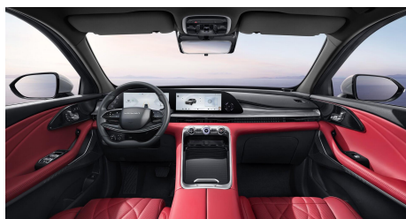
Červený interiér 0 €