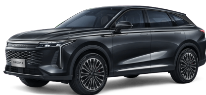
Carbon Crystal Black 600 €